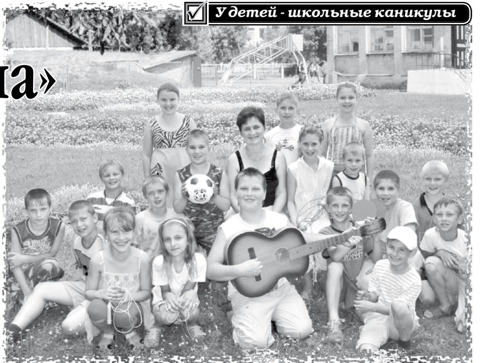
У детей - школьные каникулы

Как и в предыдущие годы, дети будут укреплять свое здоровье на базе средних общеобразовательных школ, детских садиков и других учреждений образования, в лагерях с дневным и круглосуточным пребыванием, стационарного и палаточного