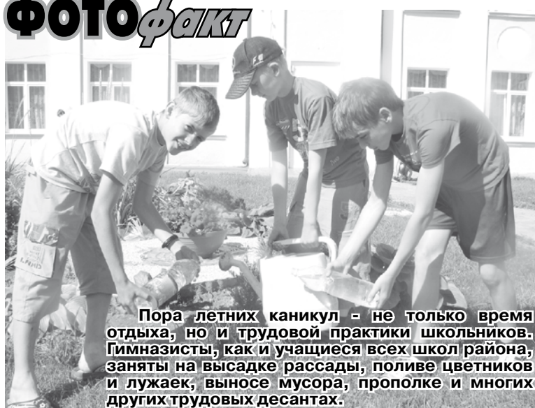
Пора летних каникул - не только время отдыха, но и трудовой практики школьников. Гимназисты, как и учащиеся всех школ района, заняты на высадке рассады, поливе цветников и лужаек, выносе мусора, прополке и многих других трудовых десантах.