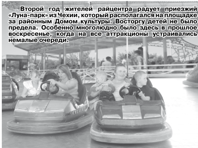
Второй год жителей райцентра радуется приезжий «Луна-парк» из Чехии, который располагается на площадке за районным Домом культуры. Восторгу детей не было предела. Особенно многолюдно было здесь в прошлое воскресенье, когда на все аттракционы устраивались немалые очереди.