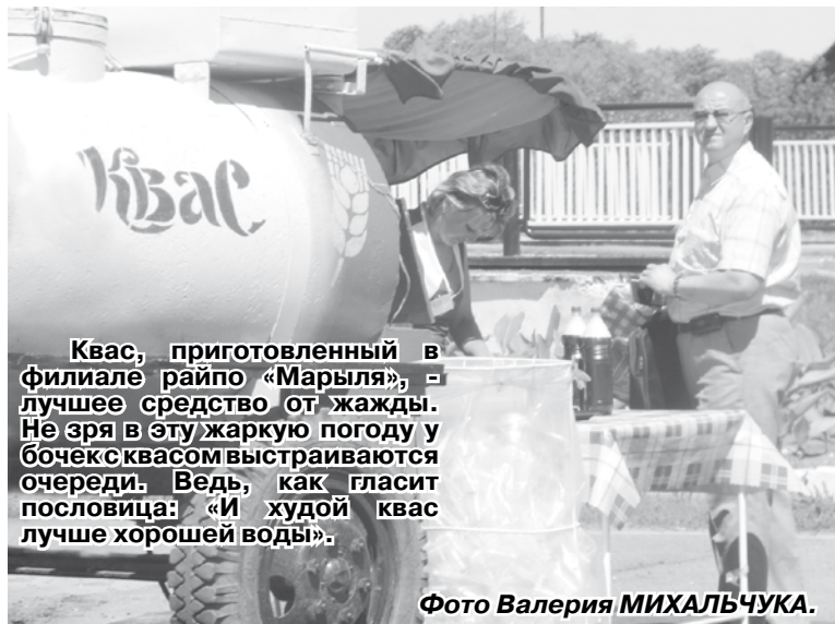
Квас, приготовленный в филиале райпо «Марыля», - лучшее средство от жажды. Не зря в эту жаркую погоду у бочек с квасом выстраиваются очереди. Ведь, как гласит пословица: «И худой квас лучше хорошей воды».