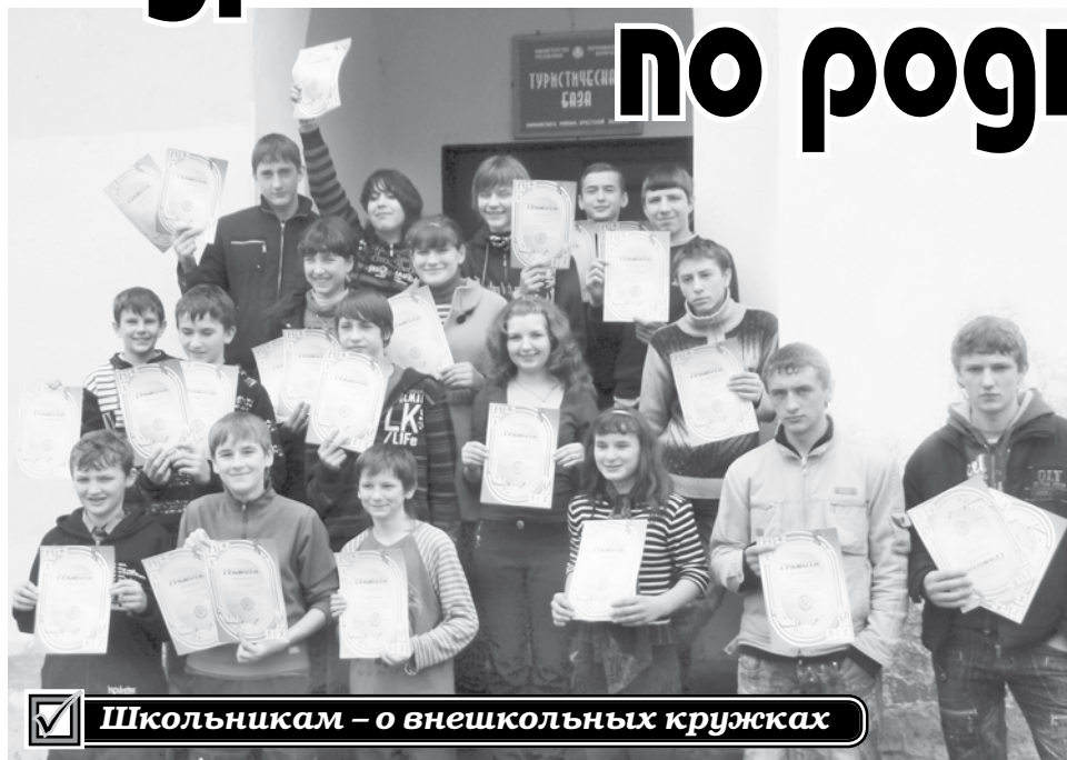
Школьникам – о внешкольных кружках

На окраине д. Огово под сенью задумчивых сосен уютно расположилось приветливое здание. В любое время года зеленогривые деревья встречают спешащую сюда шумную ребятню с озорным блеском в глазах, радостно-восторженными улыбками, в которых читается неуверенное предчувствие чего-то удивительно интересного. Неугомонные мальчишки и девчонки в спортивных костюмчиках, с рюкзаками за худенькими плечами, легко и непринужденно, как стайки воробышков, взлетают на знакомое крыльцо. А разлапистые сосны, широко раскинув свои мохнатые ветви-руки, пытаются защитить детей то от палящих лучей полуденного летнего солнца, то от холодной влаги осеннего дождя, то от внезапных порывов пронизывающего зимнего ветра.