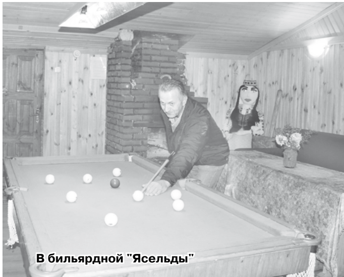
В бильярдной "Ясельды"

Президент Республики Беларусь А. ЛУКАШЕНКО.