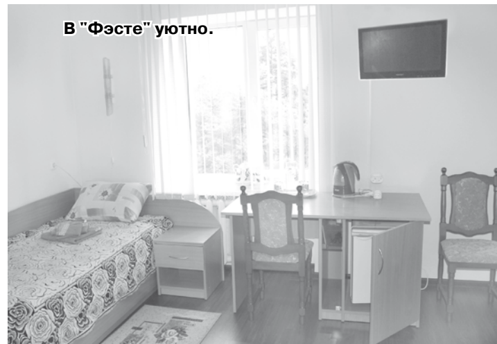
В "Фэсте" уютно.

- Наша агроусадьба может принять до 12 человек. Но, как видите, у нас сейчас идет обустройство дополнительных