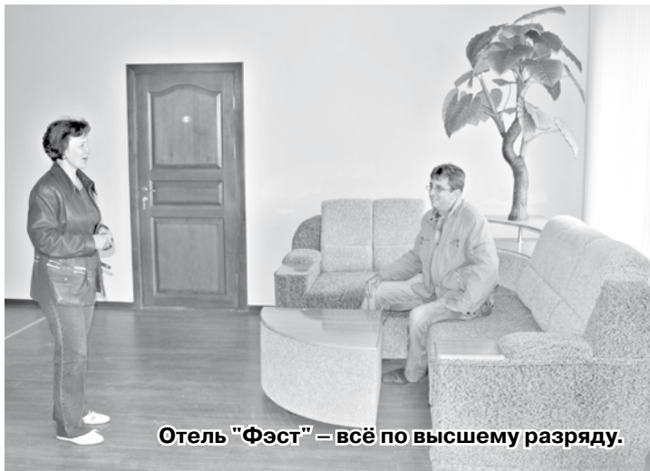
Отель "Фэст" - всё по высшему разряду.

Места здесь удивительно красивые. Когда-то река Ясельда проходила через озеро Скупое. Со временем урочище заросло, и затянуло илом и землей, и называется оно Звонинске. С ним связана одна из легенд этого края. Во время войны 1812 года, когда царское правительство дало приказ снимать с церквей колокола и переплавлять их на пушки, мотольяне испугались за свой многоголосый старинный колокол, что висел на колокольне униатской церкви, и решили его спрятать. На четырех лодках повезли его по реке Ясельда. Но на перешейке, где река соединялась с озером, перевернулись, и колокол ушел на дно. На этом месте сейчас - огромный луг. Но если присмотреться вниматель-