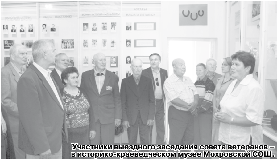
Участники выездного заседания совета ветеранов – в историко-краеведческом музее Мохровской СОШ.