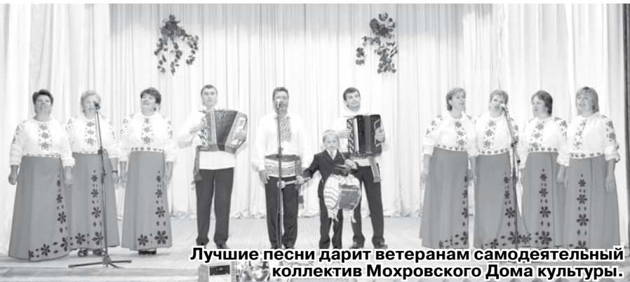
Лучшие песни дарит ветеранам самодеятельный коллектив Мохровского Дома культуры.